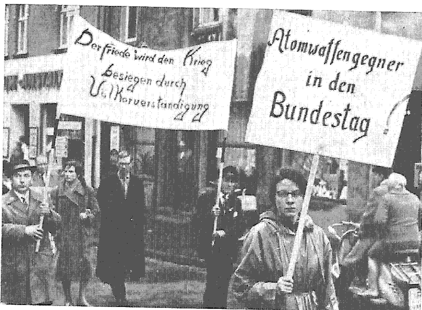
„Wählt Atomwaffengegner in den Bundestag!“ — Eine Losung der Dattelner Protestkundgebung.

Im April 1961 stellte sich heraus, daß der Bau der Raketenbasis weitergeführt wird. Sofortigen Einspruch beim Stadtrat von Würzburg beantwortete der Oberbürgermeister Dr. Zimmerer mit dem Verbot der Protestkundgebung. Er sei seit Februar von der Weiterarbeit an der Raketenbasis unterrichtet; sie werde nur vorübergehend benötigt und im Ernstfalle würden