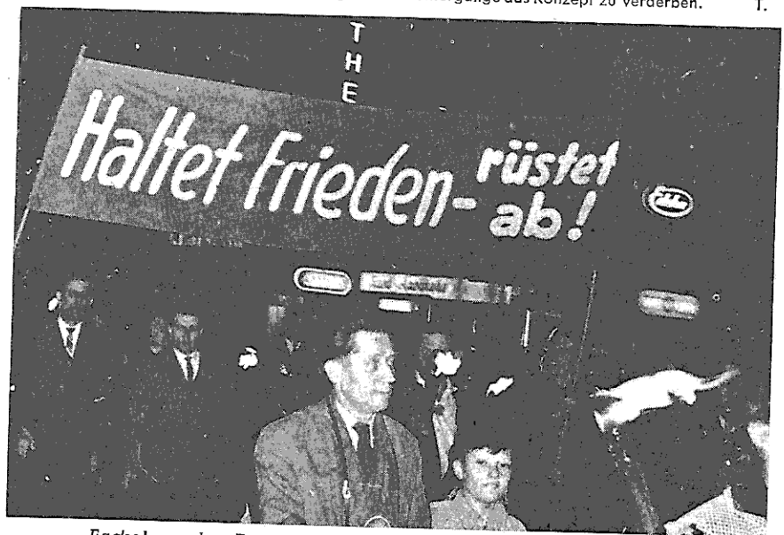
Fackelzug der Frankfurter Jugend am Vorabend des 1. Mai

Dieser Glaube an den Automatismus geschichtlicher Entwicklung — der sich schon im Buchtitel „Technik besiegt den Krieg“ ausdrückt — dürfte geeignet sein, verhängnisvolle Illusionen zu wecken, er könnte die aktiven Kräfte der Völker im Kampf für den Frieden zu seligem Nichtstun verleiten. Der Autor unterschätzt hier offensichtlich jene reaktionären Kräfte in der Welt, die zwar den technischen Fortschritt gerne akzeptieren, sich ihn sogar gewinnbringend nutzbar zu machen wissen, sich aber ganz entschieden weigern, die soziologischen Folgerungen aus der technischen Entwicklung zu ziehen; sich weigern, die Besitzstruktur der Gesellschaft der technischen Entwicklung anzupassen; sich weigern, auf liebgewonnene Privilegien zu verzichten. Wir haben leider keine Veranlassung zu der Erwartung, daß der infernalische Vorsatz des deutschen Faschismus, „die Tür krachend hinter sich ins Schloß zu werfen“, nur die grandiose Schlußapothekose eines spezifisch deutschen Raubrittertums vor seinem Abtritt in den geschichtlichen Orkus gewesen sein sollte; es wäre durchaus denkbar, daß man in der „Stunde der Gefahr“ auch anderen Ortes daran dächte, eine solche Torschlußpanik zu inszenieren. Die Völker — „gebrannte Kinder scheuen das Feuer“ — hätten allen Grund zur Wachsamkeit und täten gut daran, den Regisseuren solch herostratischer Weltuntergänge das Konzept zu verderben.