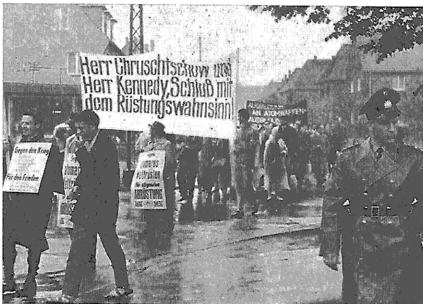
Die Idk führte in Datteln eine Protestkundgebung durch, in der sie sich gegen den Bau einer Raketenbasis in unmittelbarer Nähe der Stadt wandte. Tausende von Einwohnern Dattelns beteiligten sich an dem anschließenden Protestmarsch.

Wir alle hoffen, daß wir genug Zeit haben, eine atomare Vernichtung zu verhindern. Wir, hier in den Vereinigten Staaten und in der ganzen Welt, führen einen schweren Kampf um eine Alternative zum gegenwärtigen kalten Krieg zwischen Ost und West zu bewirken und den neuen Staaten in Afrika und Asien wirkliche Freiheit und Demokratie zu gewähren und aufzuzeigen, daß die Menschen in aller Welt wirkliche Demokratie und wirtschaftliche Zusammenarbeit wollen und sich mit leeren ideologischen Phrasen nicht abspeisen lassen. Dies betrachten wir als Sinn unserer Arbeit.