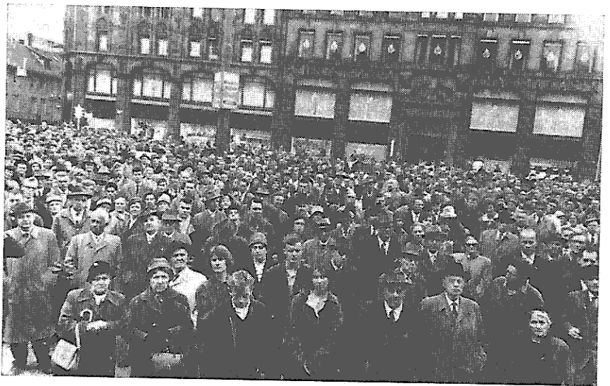
Protestdemonstration gegen das Bündnis Norwegens mit Deutschland innerhalb der NATO anlässlich des Befreiungstages in Oslo (vgl. Bericht auf Seite 10).

„Wir sind der Ansicht, daß keine Streitigkeit einen Atomkrieg rechtfertigen kann. Sogar kleine Kriege sind heute äußerst gefährlich wegen der großen Wahrscheinlichkeit, daß ein kleiner Krieg zu einer Weltkatastrophe anwächst. Angesichts der Gefahr und der Instabilität des gegenwärtigen Wettrennens besteht die einzig vernünftige Politik darin, eine allgemeine, vollständige und weltweite Abrüstung mit einer geeigneten internationalen Kontrolle und Überwachung anzustreben. Dies ist das erklärte Ziel der Atommächte und aller anderen Nationen.“