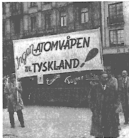
Auch in Norwegen: Proteste gegen Atomwaffen in den Händen deutscher Generale

Wissenschaft und Forschung sind von ihrer Tradition her international; in ihnen arbeiten Menschen in vielen Teilen der Welt bei der Verwirklichung von Zielen zusammen, die über ihr persönliches Leben hinausgehen. Diese durch gemeinsame Anstrengung entstandene Verbindung ist von entscheidender Bedeutung dafür, daß es uns