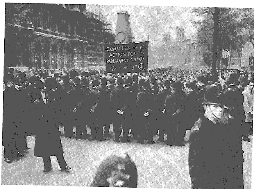
Demonstration der englischen Atomrüstungsgegner auf dem Parliament Square in London (vgl. nebenstehenden Bericht).