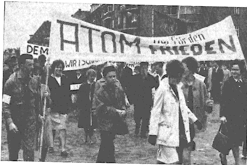
Ein Transparent des Jugendzuges der Mai-Kundgebung in Hamburg.

zu verschiedenen ziemlich wesentlichen Fragen unsere grundsätzliche Übereinstimmung im Bereich der wichtigsten Frage überdeckten, nämlich der Abrüstungsfrage und ihrer ökonomischen Konsequenzen. Alle Konferenzteilnehmer waren voll der Anerkennung für Herrn Baade und bürdeten ihm die Verantwortung für die ersten Schritte zur Einberufung der nächstfolgenden Konferenz auf, die, wie ich schon erwähnte, umfassender sein und