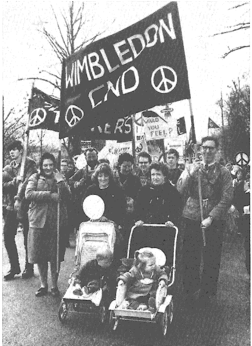
Fast hunderttausend Menschen nahmen an den englischen Ostermärschen von Aldermaston und Wethersfield nach London teil. Unser Bild zeigt einen Ausschnitt aus dem Aldermaston-Marsch.