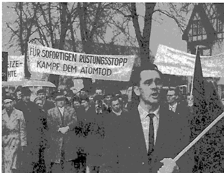
Demonstration in Neumünster