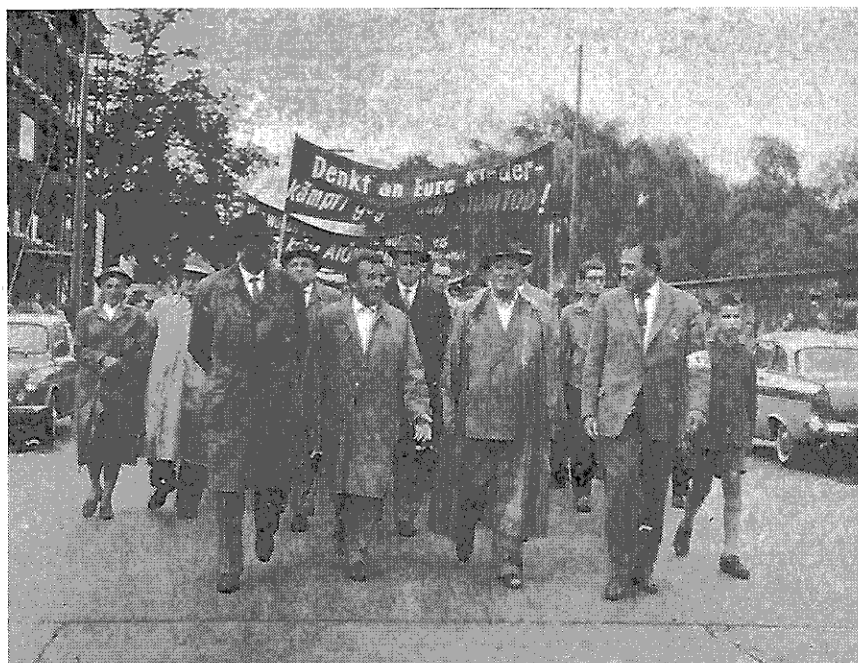
Frühjahr 1958: Demonstration des Münchener „Komitees gegen Atomrüstung“

Dr. Erich Kästner teilte unsere Ansicht, daß alle Gruppen gegen die atomare Aufrüstung miteinander im Gespräch bleiben sollten. Ob sie etwas gemeinsam unternehmen, muß jeweils am vorliegenden Fall erörtert werden. Getreu den Aufgaben des „Ständigen Kongresses“ wird das Büro und das Präsidium auch weiterhin versuchen, durch persönliche Rücksprachen das gegenseitige Verständnis zu fördern, um letzten Endes zum gemeinsamen Handeln zu kommen. Die fehlende Gemeinsamkeit aller aufrechten Demokraten in der Vergangenheit hat stets dazu geführt, daß die restaurativen Kräfte durch ihr einheitliches Auftreten die Mehrheit des Volkes für sich gewinnen konnten. Das Ergebnis kennen wir. Die letzte Katastrophe war eine deutliche Warnung. K. O.