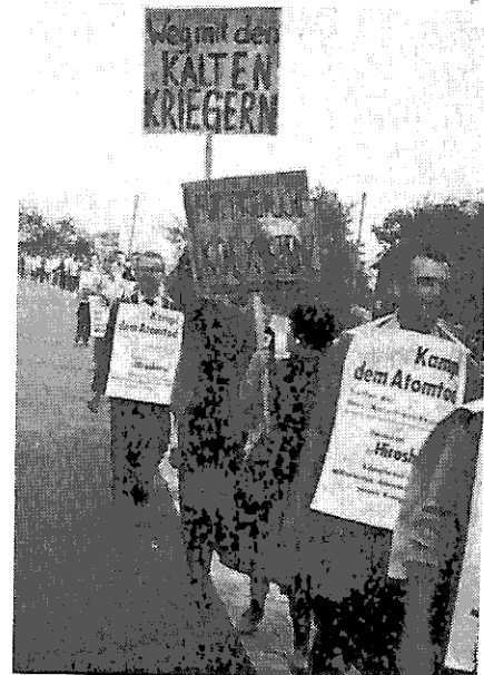
Demonstration gegen die Kalten Krieger