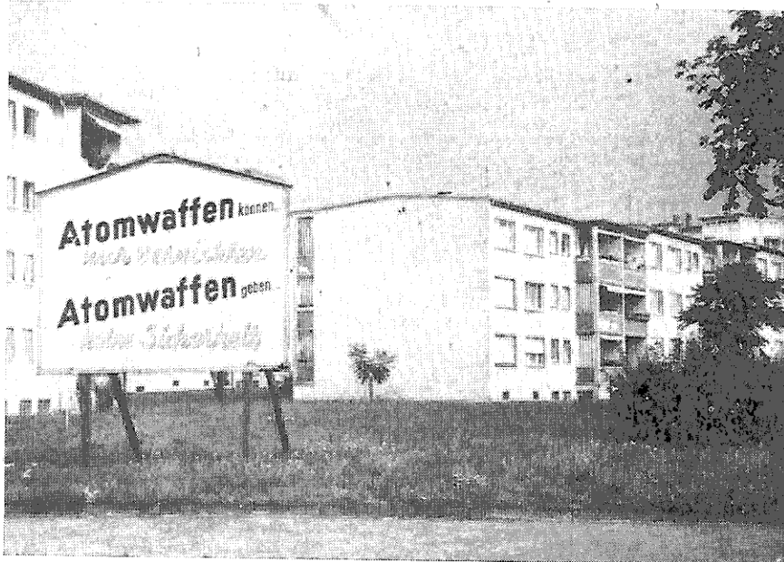
Frankfurt/Main — Neue Siedlung

Noch vor wenigen Monaten stieß man auf starken Widerspruch mit der Behauptung, daß die Sowjetunion keine militärische Aggression gegen Europa plane. Inzwischen haben sich die Propagandaparen des Kalten Krieges geändert. Natürlich wollen die Sowjets den Frieden, so sagt man auf einmal, denn die haben den Vorteil davon, wir aber werden durch ihn in eine hoffnungslose Lage gebracht, und deswegen haben wir ein Interesse daran, daß dieser kommunistische Friede nicht weiter andauert. Herr Schlamm hat das Verdienst, diese These kalt und klar verkündet und damit eine starke Gruppe von Anhängern entlarvt zu haben. Diese Leute sind entschlossen, aufs Ganze zu gehen und zwar mit Hilfe der Bundesrepublik. Amerikaner wie Russen haben eine abergläubische Vorstellung von der Weltüberlegenheit der deutschen Armee. Nun kann die heutige Bundeswehr schwerlich mit der Wehrmacht des Dritten Reiches oder des kaiserlichen Deutschland verglichen werden, nicht zuletzt, weil die jungen Menschen eigentlich nicht wissen, wofür sie kämpfen. Ohne ein