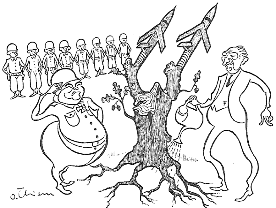
Bundesrepublikanische Okulierversuche an der „Deutschen Eiche“

ganische Abneigung gegen die Offensive haben und erst dann großartig kämpfen, wenn sie in die Enge getrieben worden sind. Aber ebenso viel Wahres steckt in der anderen Beobachtung: daß die westlichen Nationen die Nase voll haben von einer offenbar sinnlosen Aufrüstung. Die Staatsmänner des Westens werden zwischen zwei gleichermaßen unpopulären Haltungen zu wählen haben — entweder eine sinnlose Rüstung gegen ein zunehmend stürmisches Massen-Veto durchzusetzen oder eine obstinate pazifistische öffentliche Meinung resolut von der Notwendigkeit zu überzeugen, daß der Kommunismus siegen muß, wenn der Westen nicht die Offensive ergreift.“ Dazu gehört nach Schlamm ein sofortiger Friedensvertrag der Vereinigten Staaten mit Deutschland. Er hätte klarzustellen, „daß in den Augen des Westens die Souveränität der Bundesrepublik alles deutsche Gebiet einschließt, das von der ganzen Welt — einschließlich der Sowjetunion — am Tage vor Hitlers Machtantritt als deutsches Gebiet anerkannt war... und er müßte den ab-