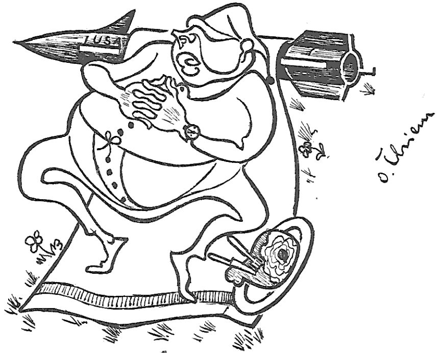
Lethargie in Bundes-schlemm-schlamm-schla- und raffia