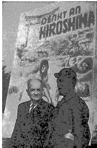
Atommahnwache in Essen

Zu den grundlegenden Erfahrungen der Konferenz gehört die Einsicht, in wie hohem Maße das Verlangen der afroasiatischen Völker nach Befreiung inzwischen eine Selbstbefreiungsaktion ausgelöst hat; Freiheit und Frieden sind für sie schlechthin identisch geworden. Die Bedrohung der Menschheit durch die nukleare Aufrüstung muß darum notwendig als ein Bestandteil der allgemeinen Unterdrückung im Kolonialismus verstanden werden. Der Widerstand gegen die während der Tage so oft genannten „A- und H-Bomben“ bedeutete das Sich-zur-Wehrsetzen gegen fremde Mächte, die nach aller unglückseligen Herrschaft nunmehr mit diesen Massenvernichtungsmitteln den letzten Trumpf einer totalen Gewalt ausspielen. Der Imperialismus mündet mit dämonischer Konsequenz in einen Atomkrieg. Eben das macht den Kampf dieser Völker so eindrucksvoll: das Ende aller Unterdrückung wird gleichbedeutend mit