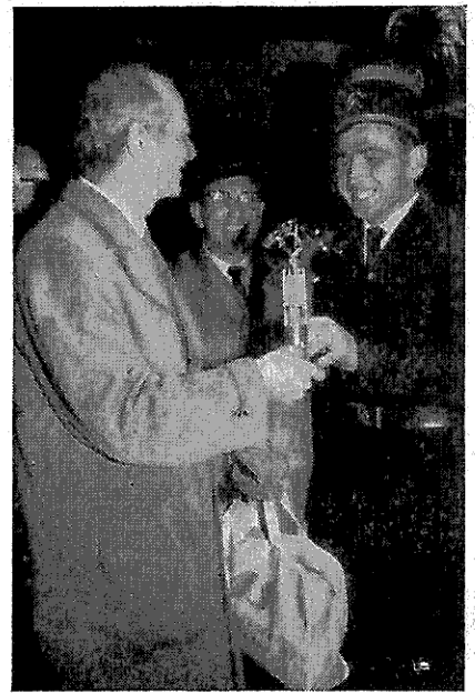
Bergarbeiter überreicht Prof. Pauling eine Grubenlampe

„In einem voll entfaltetem Atomkrieg gibt es keinen Sieger. Sogar die neutralen Staaten und künftige Generationen würden darunter schwerstens zu leiden haben. Jeder kleine