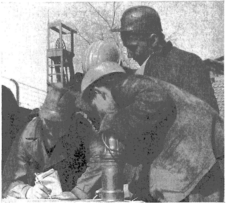
Die Unterschriftensammlung „Für eine atomfreie Zone — gegen Raketenbasen“ der Essener IdK an öffentlichen Plätzen und vor Schachtanlagen brachte bisher über 10 000 Unterschriften. Das Bild zeigt Jungbergleute der Zeche „Fritz Heinrich“, die sich bei Schichtwechsel in die vor der Schachtanlage ausliegenden Listen eintragen.

Wir mußten erleben, wie die Kameraden in ihren Erdlöchern von darüberrollenden Panzern in die Luft gesprengt, wie auf den Hauptverbandsplätzen die Leichen wie Holzschelte zu Stapeln aufgebaut wurden, Bilder, die dann durch den Tod in den Konzentrationslagern auch in die ganze Welt gingen. Auch ich habe das erlebt und anderes dergleichen. Soll das alles vergessen und umsonst gewesen sein? Es ist nicht schön, daran denken zu müssen, aber es ist notwendig. Nicht nur als Ärzte sollten wir daran denken, als Mütter und als Menschen. Wir sollten es zumal in den verantwortlichen Stellen, die heute Soldaten für einen dritten Weltkrieg ausbilden. — Gegen den dritten Weltkrieg wird der zweite Weltkrieg, den wir hinter uns haben, ein Kinderspiel sein. Was er bringen wird, das haben die Bilder von Hiroshima und Nagasaki nicht etwa gezeigt, sondern in Schwäche angedeutet. Die Explosionen der heutigen Atombomben werden noch viel grauenhaftere Wirkungen haben als die von Hiroshima u. Nagasaki. Wir alle, einschließlich der Männer, die einen solchen Krieg vorbereiten und auslösen werden, werden das nicht überleben. Es ist ein bequemes Alibi, wenn Verantwortliche, die nebenbei im letzten Weltkrieg nicht Soldaten waren, derartige Überlegungen mit dem Begriff einer Angstpsychose bagatellisieren zu können glauben. Wer den letzten Krieg wirklich erlebt hat, dem ist die Angst tatsächlich vergan-