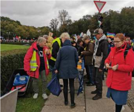
Umlagerter Stand am Stern Demo am 03.10.2024

Busse zur Demo nach Berlin gefüllt. In jedem Bus haben DFG-VK AktivistInnen einen Infostand mitgenommen und den an unterschiedlichen Stellen sowohl bei der Auftaktkundgebung als auch bei der Abschlusskundgebung aufgestellt. Ein Stand wurde von der Gruppe Kiel betrieben, der andere gemeinsam von Aktiven der Gruppen Oldesloe, Lübeck und Westküste. „Gut, dass ihr da seid“ hörten wir von Vielen aus Friedensgruppen. DFG-VK Aktive mit Verbandsfahne in der Hand aus anderen Ecken der BRD kamen erfreut auf uns zu.