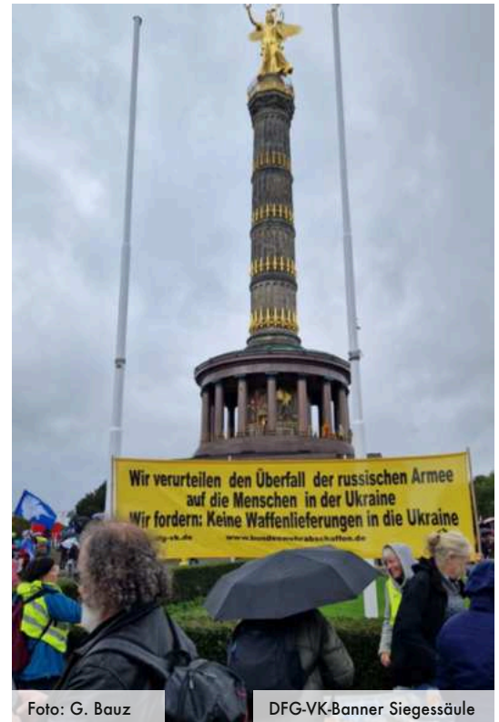
DFG-VK-Banner Siegestsäule

Im Vorfeld der Demonstration hat mich das destruktive Agieren einiger Aktiver, die unter Landesverband Berlin/ Brandenburg firmieren, dazu bewegt, aktiv als DFG-VK auf der Demo aufzutreten, um zu zeigen, dass diese paar Menschen nicht die DFG-VK sind. Die Kritik des BundessprecherInnenkreises und von drei der Angestellten der DFG-VK kann ich nachvollziehen. Deren Handlungskonsequenz, diese Kritik in einer Stellungnahme an die Presse zu tragen, bevor sie mit den Basisgruppen der DFG-VK rückgekoppelt wurde, kritisiere ich scharf. Der BundessprecherInnenkreis hat nicht für die DFG-VK Basisgruppen in Hamburg und Schleswig-Holstein gesprochen.