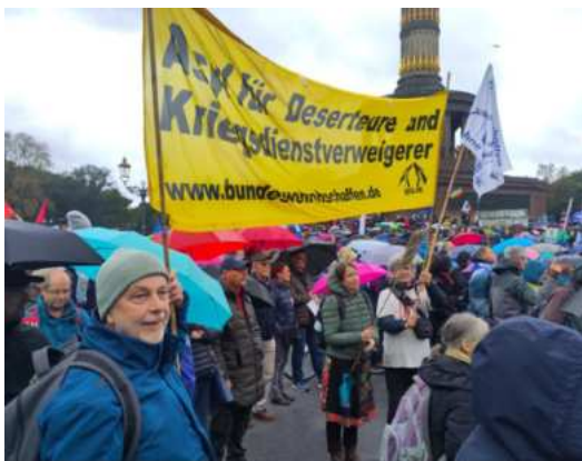
Demo am 03.10.2024