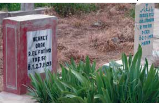
Gräber von vermutlich mit deutschen Waffen getöteten Kurden

Türkische Rüstungsexport-Riesen im Großwaffenbereich. Mehr Geld bedeutet mehr Rüstungsbeschaffungen und -exporte. In seinem Ranking der Top 100 rüstungsproduzierender und -exportierender Unter-