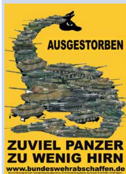
Format A3; 0,10 €/Stück + Porto