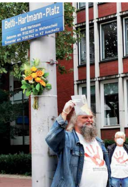
Der Autor mit dem antifaschistischen Stadtplan

Schließlich fand am Sonntag, den 11. Oktober, auf Grundlage dieses Stadtplans ein erster antifaschisti-