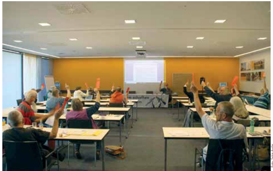
Landesdelegiertenkonferenz der DFG-VK NRW Mitte September in Duisburg

Nun ist es ja nicht gefährlich, dass sich Menschen für Freiheitsrechte einsetzen. Und es ist berechtigt, die einzelnen Maßnahmen der Regierung und der Behörden kritisch zu hinterfragen. Nachdenklich stimmt es jedoch, dass sich dieser Freiheitsdrang