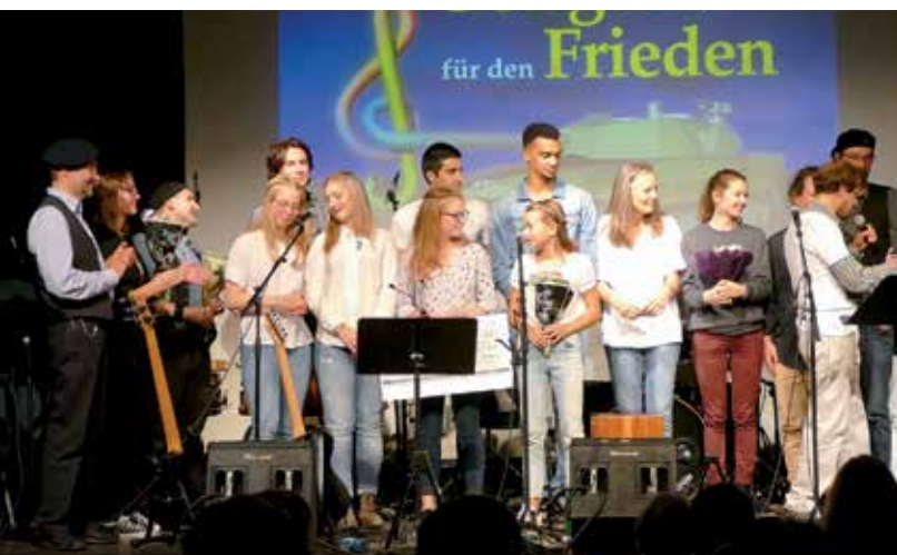
Alle GewinnerInnen auf der Bühne bei der Preisverleihung 2018