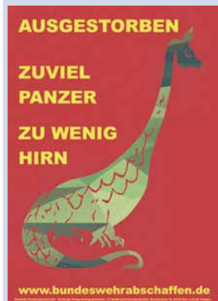
Format A1; 0,20 €/Stück + Porto

Nun hat der DFG-VK-Landesverband Hamburg/Schleswig-Holstein sie neu aufgelegt. Bestellt werden können die über den Shop der DFG-VK im Internet unter der Adresse: https://shop.dfg-vk.de/Plakate/