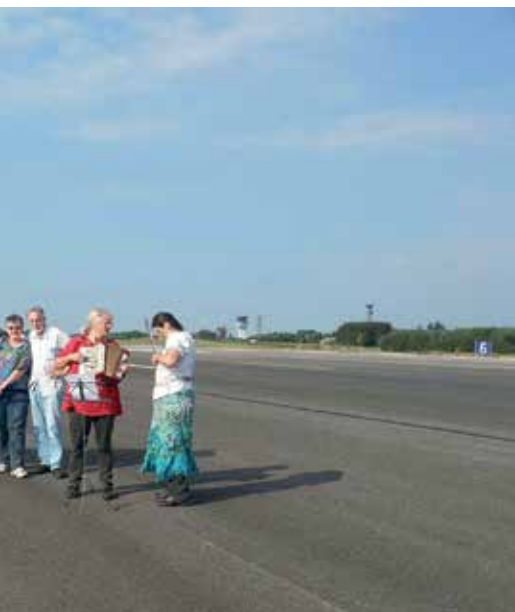
am Bücheler Bundeswehr-Flugplatz