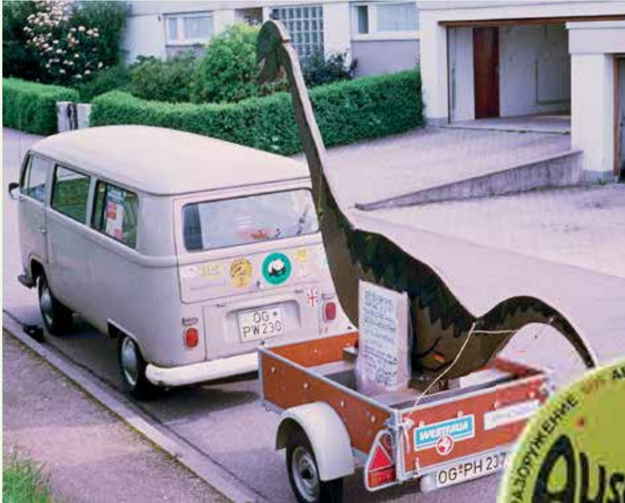
Zuviel Panzer, zuwenig Hirn: Über Jahre ein Blickfang bei jeder Demo

» Bei großen überregionalen Aktionen war die Gruppe ebenfalls gefordert. Als Beispiel sei genannt die Menschenkette von Stuttgart nach Neu-Ulm im Herbst 1983. Da war es unsere Aufgabe, die Werbung und den Fahrkartenverkauf für einen der Sonderzüge in ganz Mittelbaden zu übernehmen. Als sich dann herausstellte, dass der Zug völlig überfüllt sein würde, waren innerhalb weniger Tage noch mehrere Busse zu organisieren, was sich als schwierig erwies.