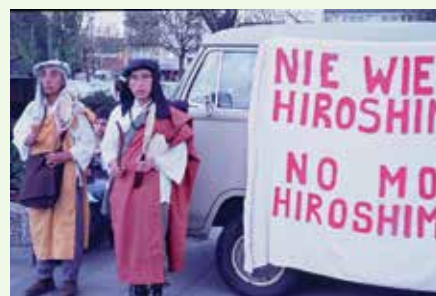
Japanische Mönche bei der DFG-VK-Abrüstungsstafette 1977 in Achern