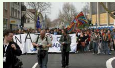
Demo gegen den Nato-Gipfel 2009 in Baden-Baden