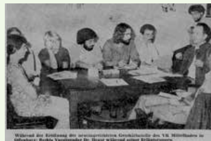
Bericht im „Badischen Tagblatt“ 1974