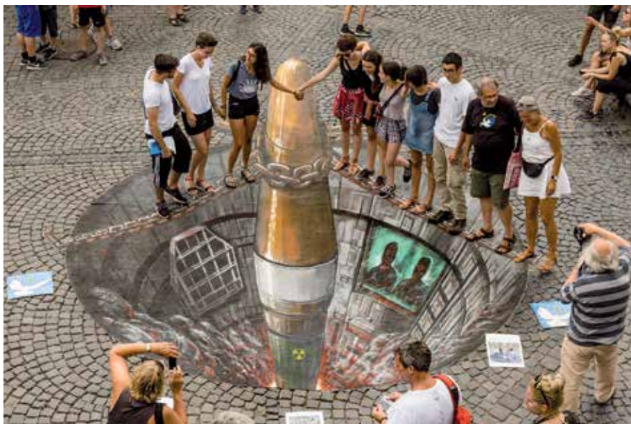
Mit Atomwaffen am Abgrund

Reaktionen in der Region. Die AnwohnerInnen brachten in diesem Jahr noch mehr ihre Sympathie für unsere Aktionen zum Ausdruck. Vergünstigungen bei Einkäufen und immer wieder Zustimmungsausprägungen, begrüßendes Hupen besonders stark nach Aktionen - es gab früher ein Schild: „Bitte hupen, wenn Sie für den Abzug der Atombomben sind!“ - und viele Daumen der AutofahrerInnen, die nach oben zeigen!