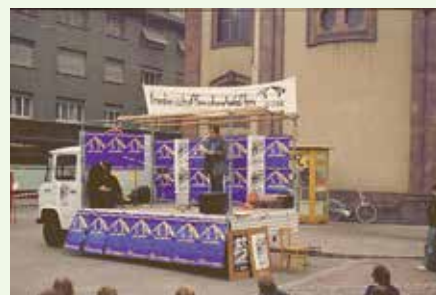
Demo gegen die Ausstellung „Unser Heer“ 1978 in Rastatt

Auch in anderer Hinsicht ist die Gruppe bei internationalen Aktionen immer wieder dabei. So beteiligt sie sich seit vielen Jahren in der Vorweihnachtszeit regelmäßig an der Grußkartenaktion der War Resisters' International. Hunderte von inhaftierten Kriegsdienstverweigerern und Rüstungsgegnern haben im Laufe der Jahre Post aus Mittelbaden bekommen. Für einige der Gruppenmitglieder, die sonst eher nicht aktiv sind, ist der Kartenabend im Winter - nach eigener Aussage - der wichtigste Termin im Gruppenleben.