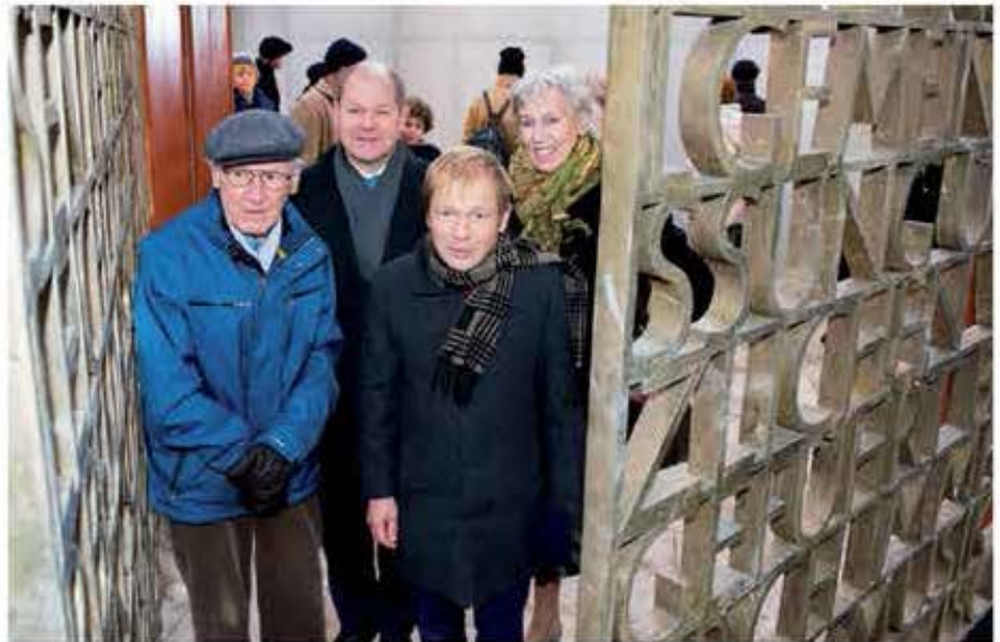
Ludwig Baumann (L.) und der damalige Erste Bürgermeister und heutige Bundesfinanzminister Olaf Scholz (SPD) 2015 am Deserteurdenkmal in Hamburg