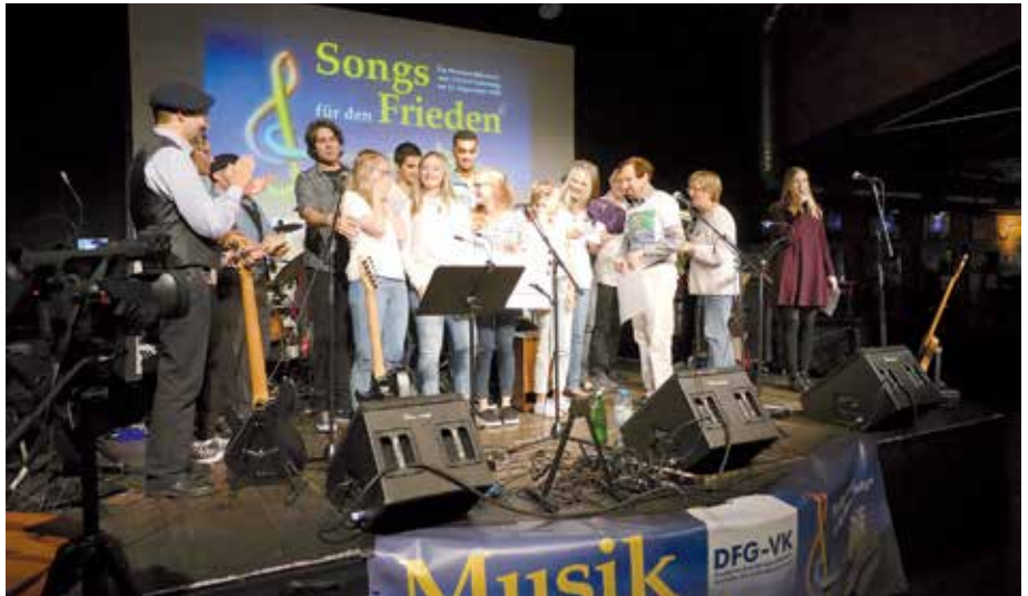
Alle Wettbewerbs-TeilnehmerInnen auf der Bühne

Leider mussten wir feststellen, dass innerhalb der Friedensbewegung und sogar in der DFG-VK der Friedenssong-Wettbewerb „stiefmütterlich“ behandelt wird. Wir sind in der Musikszene mittlerweile bundesweit bekannter als in der Friedensbewegung, und das gibt uns schon zu denken. So werden viele Synergieeffekte durch