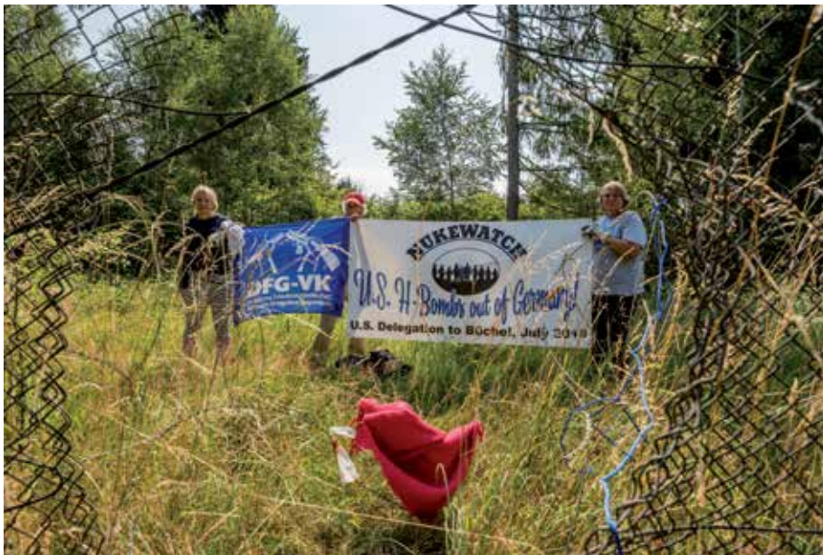
Internationaler Protest auf dem Fliegerhorst-Gelände in Büchel