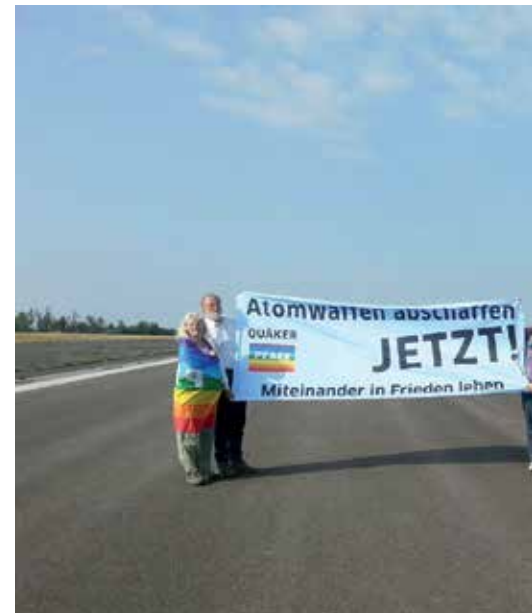
Startverbot für Atomwaffen: Blockade der Startbahn auf de