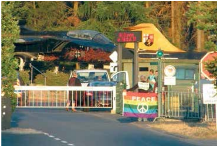
Protest mit der Peace-Fahne vor dem Haupttor des Fliegerhorsts in Büchel

» Im September trafen sich 34 Aktive zum offenen Strategietreffen des Kampagnenrates Büchel ist überall! atomwaffenfrei.jetzt! und vereinbaren: