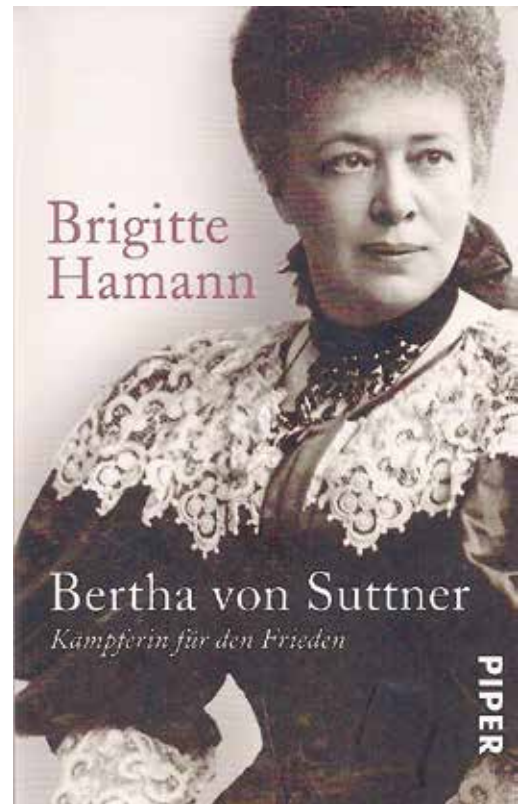
Brigitte Hamann: Bertha von Suttner. Kämpferin für den Frieden. München 2015; 320 Seiten; 12,99 Euro

Das Lesen der Hamann'schen Biographie trägt nicht zu einer Glorifizierung Bertha von Suttners bei, aber immerhin dazu, dass das Urteil über sie gerechter und fundierter ausfällt. Natürlich ist nicht alles haltbar, was sie getan, geschrieben und gesprochen hat. Beispielsweise ihre naive und schon damals unverständliche Einschätzung des russischen Zaren. Wobei man gerechterweise sagen muss, dass manche Pazifisten den Nachfolgern des Zaren auch ein wenig naiv gegenüberstanden. Aber Suttner war ansonsten eine realpolitisch handelnde Aktivistin. Ihre Versuche, Einfluss auf die Haager Friedenskonferenz oder die Internationale Parlamentarische Union zu nehmen und in ihnen mitzuwirken, waren hochpolitische Ansätze und keineswegs Utopien oder Visionen. Ähnlich dem Niemöller'schen Postulat „Was würde Jesus dazu sagen?“ wäre es interessant zu überlegen, „was würde Bertha von