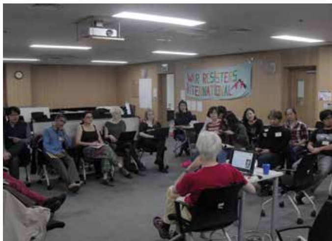
Workshop in Seoul zur Vorstellung der „Aktion Aufschrei“

gendlichen und dynamischen Aktiven von World Without War ist, dass sie ihre Aktionen regelmäßig mit einem fröhlichen Tanz und einem Lied beenden, auch beim Protest gegen die Adex: Ein Youtube-Film vermittelt einen Eindruck von Tanz und Lied: https://www.youtube.com/watch?v=RIMDFrDQxTQ&list=PL573DC6398B-95D8E82