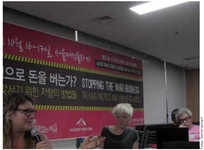
Die britische Campaign against Arms Trade stellt sich beim Seminar vor

Am Ende des Korea-Kriegs 1953 wurde lediglich ein Waffenstillstand vereinbart, jedoch kein Friedensvertrag abgeschlossen. Es kommt auch immer wieder zu Spannungen, Drohungen mit Gewalt und Schüssen. Ein Besuch der Demilitarized Zone (ein Euphemismus für das vermutlich militarisiertere Gebiet der Welt) entlang der Waffenstillstandslinie wirkt einerseits beklemmend. Andererseits war ich überrascht, dass die Touristengruppe, in der ich reiste, in der Hauptverhandlungsbarracke in Panmunjom, die genau auf der Grenzlinie steht, aufgefordert wurde, sich auf nordkoreanischem Boden unter den wachsamen Augen zweier wachsigen nordkoreanischer Soldaten