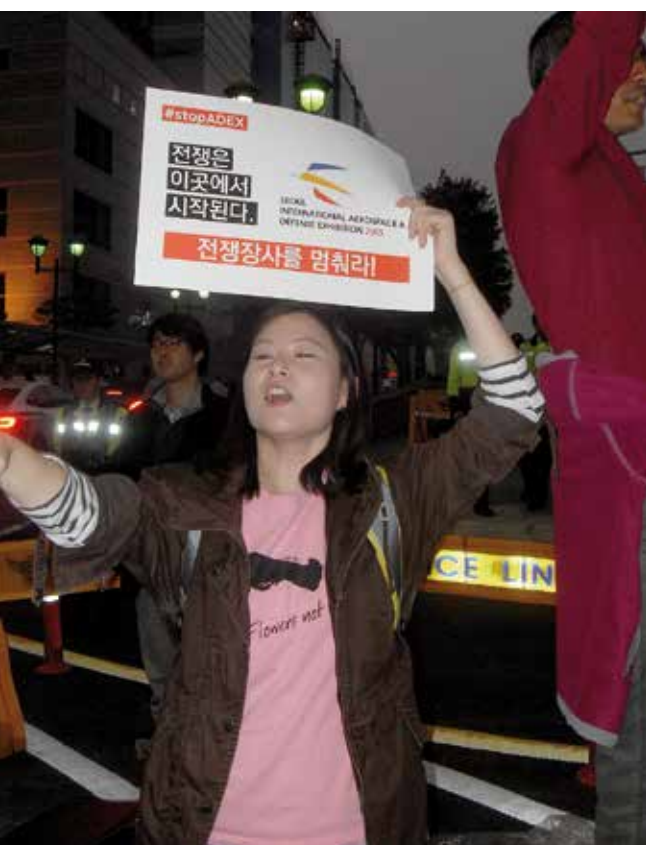
Protest gegen die Rüstungsmesse Adex

Andere Neuigkeiten zur Kriegsdienstverweigerung kommen aus Nepal: Dort hatte die maoistische Partei vorgeschlagen, den Zwang zum Kriegsdienst einzuführen, scheiterte aber damit.