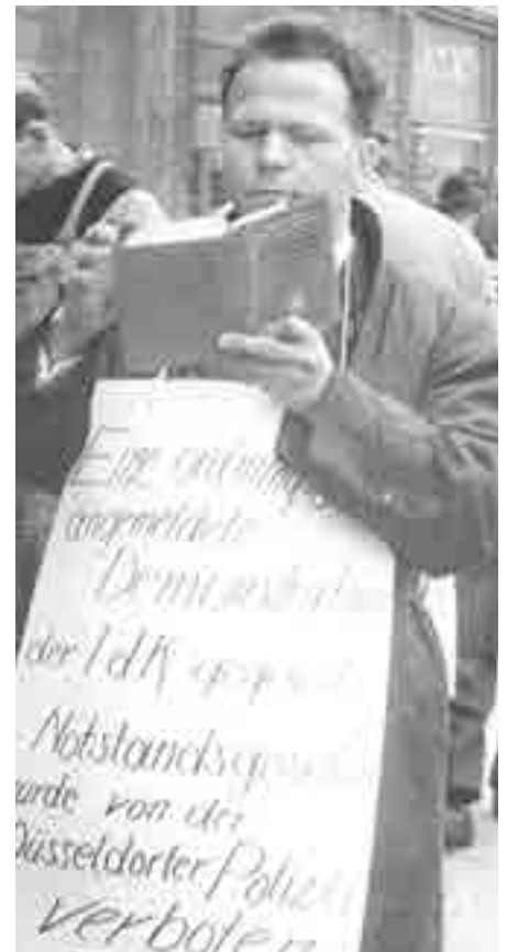
... für Frieden und gegen Krieg