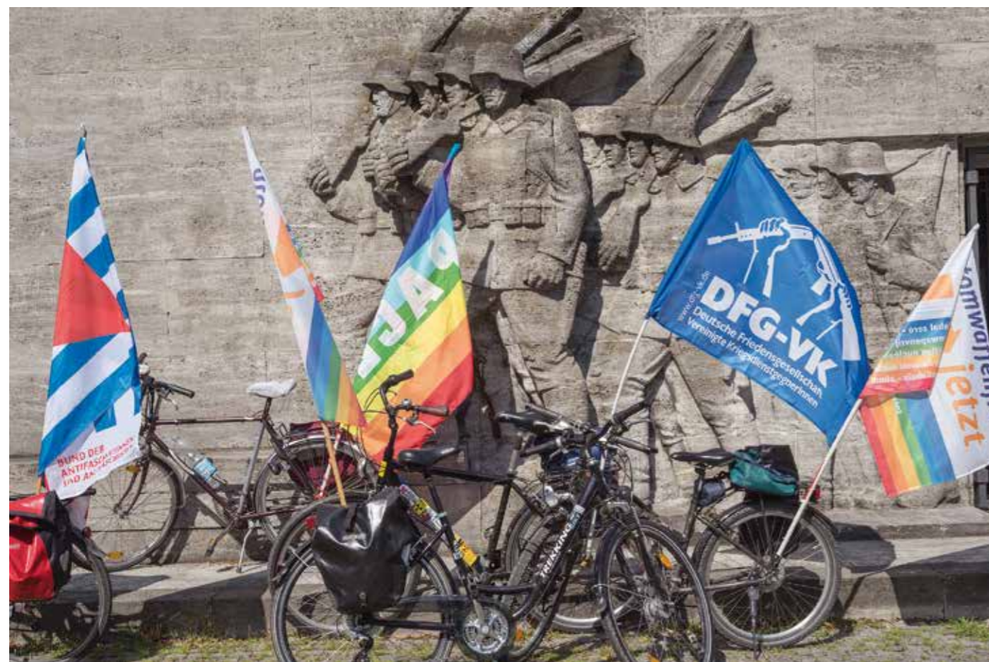
Protest vor einem Kriegerdenkmal in Düsseldorf

Parallel entstand die Idee, ein großes sinnfälliges Symbol auf den Marienplatz