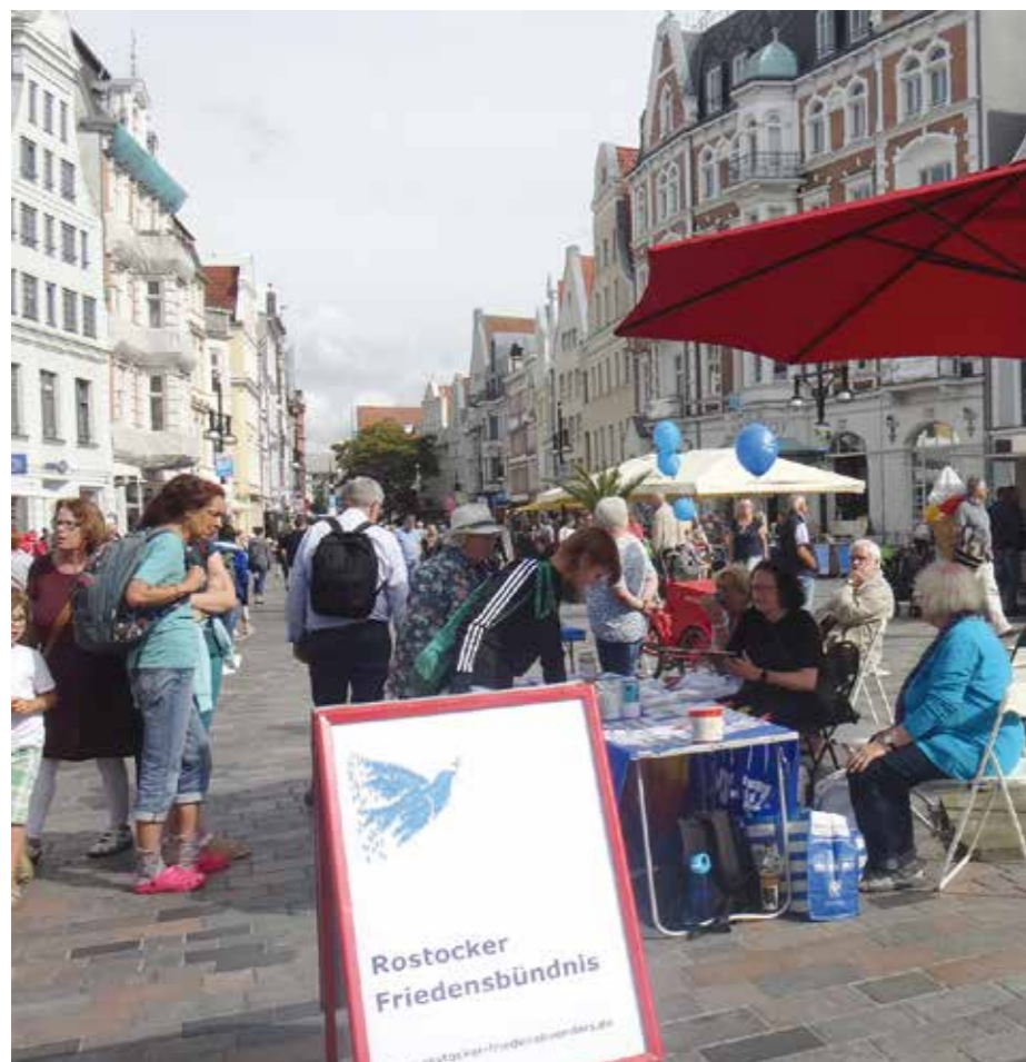
Gemeinsamer Infostand von DFG-VK und Rostocker Friedensbündnis

wollten mit der Bevölkerung der Region ins Gespräch kommen.