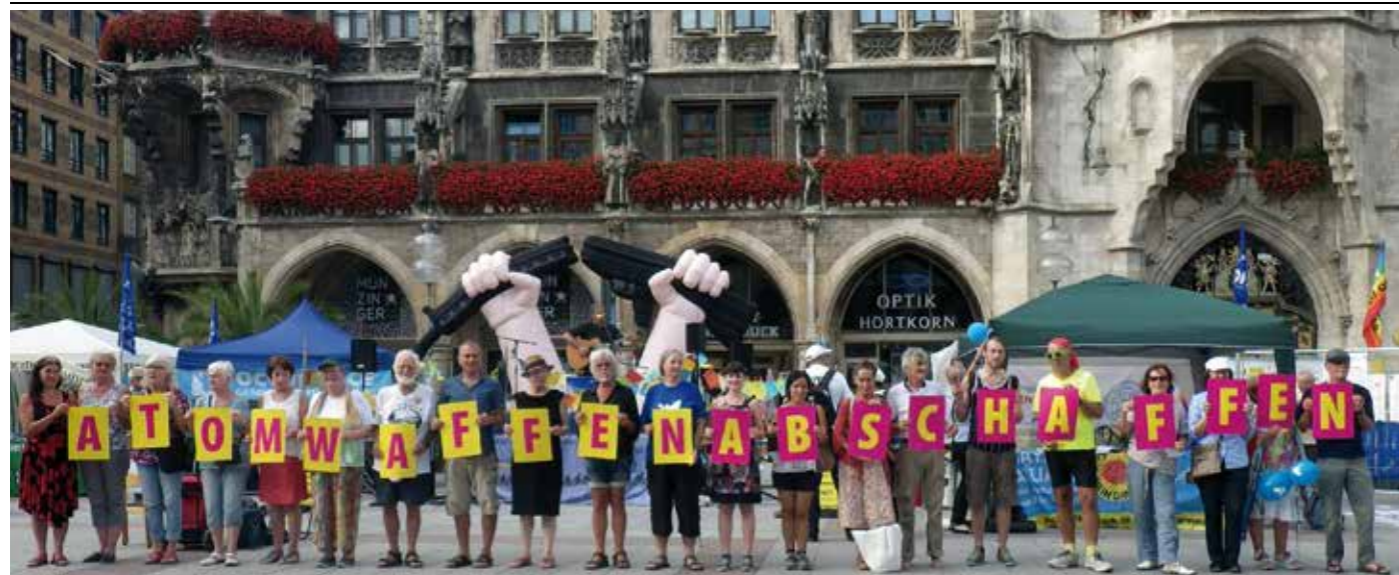
Ein überdimensionales zerbrochenes Gewehr auf dem Münchner Marienplatz

zu stellen, das unser Anliegen vermitteln sollte. Ergebnis: Das zerbrochene Gewehr, Symbol der Internationale der Kriegsdienstgegner, aus Kunststoff, aufblasbar und einige Meter hoch. Alle verstanden die Botschaft: Gewehr kaputt, Krieg zu Ende.