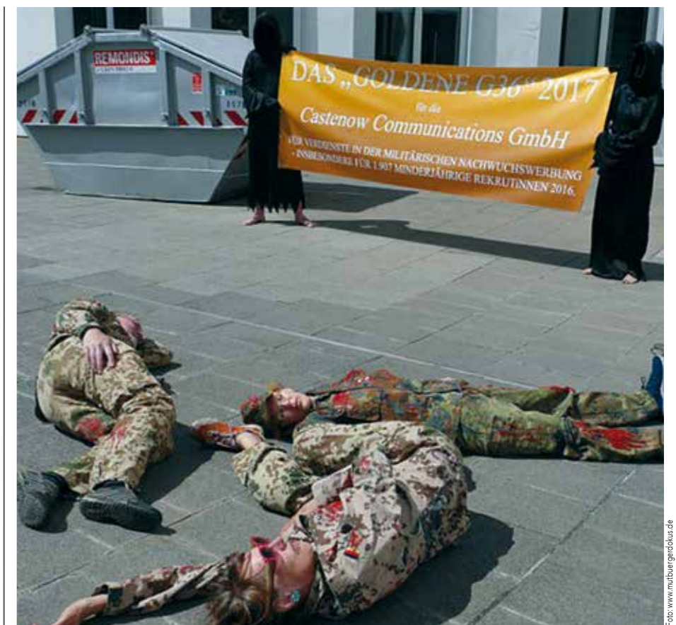
Die-in-Aktion vor der Werbeagentur, die die Bundeswehrklame macht

Für viele TeilnehmerInnen war es schockierend, wie sehr NRW mit Mili-