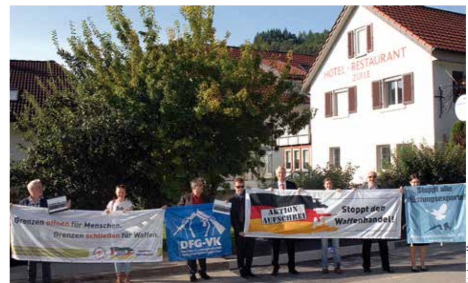
Protest bei der Heckler & Koch-Aktionärsversammlung im Provinzgasthaus