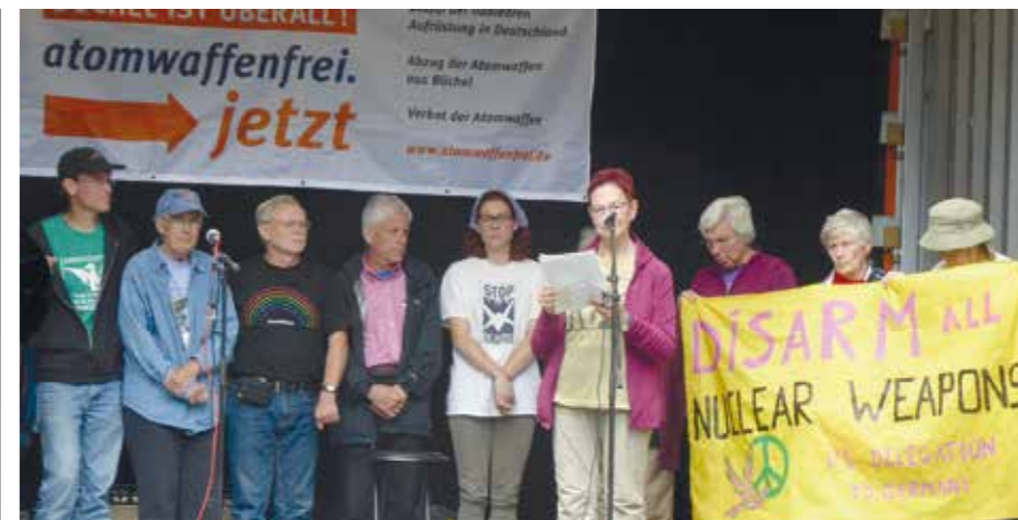
„Rüstet alle Atomwaffen ab“ fordern in Büchel FriedensaktivistInnen aus den USA

Ich kann als Mitwirkende des Kampagnenrates der Kampagne Büchel ist überall - atomwaffenfrei.jetzt! schon jetzt sagen, dass die diesjährigen Aktionen meine Erwartungen weit übertroffen haben und wir mit den Selbstver-