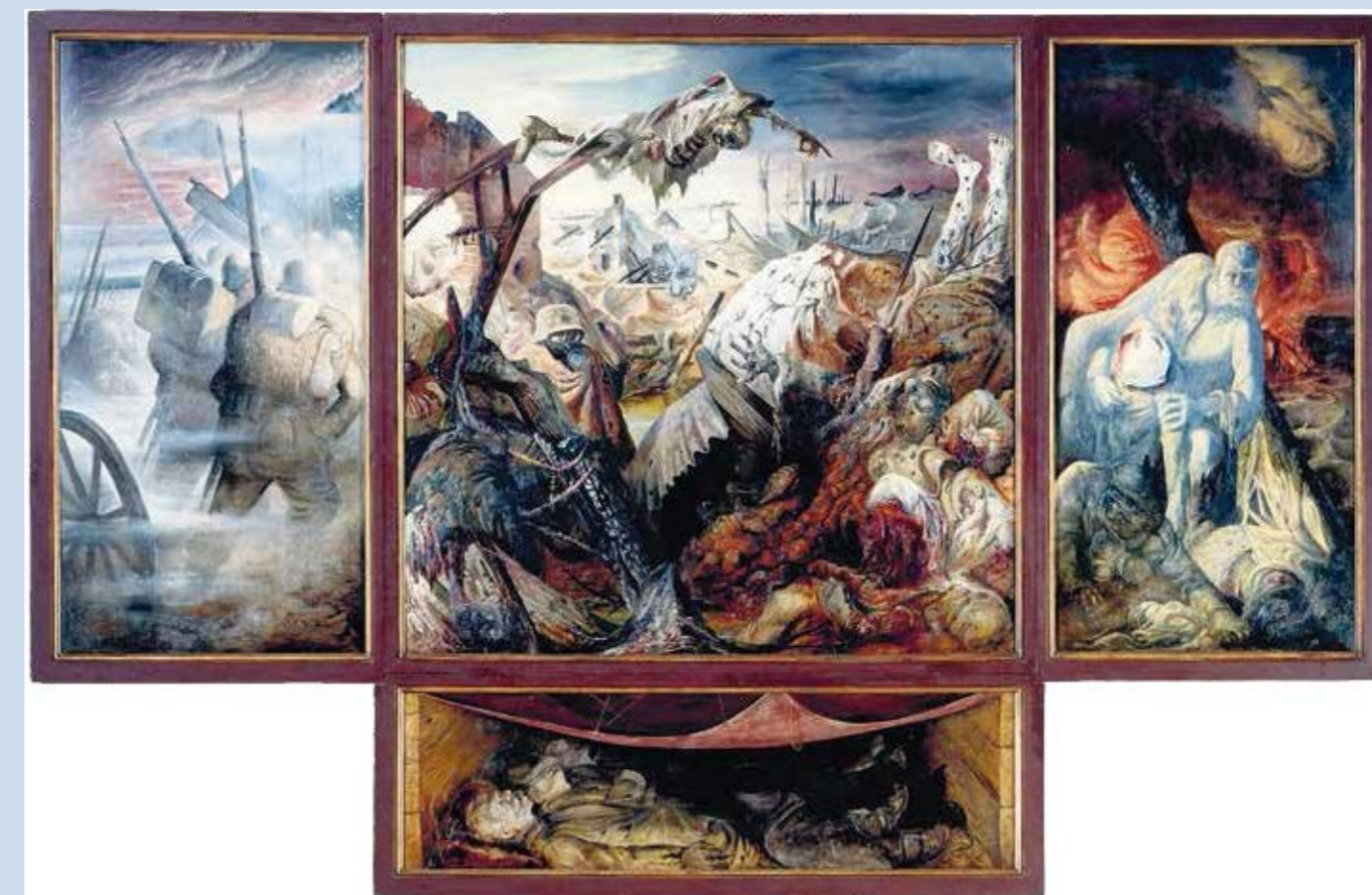
Otto Dix: Der Krieg (1929 begonnen, 1932 vollendet)

Sind das Fragen, über die man mit den Kriegsenkeln ins Gespräch käme? Was wären generationsübergreifende Anlässe für Gespräche? Wie kann man über Krieg sprechen, wenn man vom Krieg nur gehört und gelesen hat? Was bedeutet Frieden in einer global ungerechten Welt? Es ist dringend notwendig, dass die Generationen miteinander ins Gespräch kommen und Schweigegebote und Hilflosigkeit überwinden. Die Deutsche Friedensgesellschaft-Vereinigte KriegsdienstgegnerInnen könnte helfen, an eigene jeweils gemachte Erfahrungen anzuknüpfen. Fangen wir der Einfachheit halber bei uns beiden