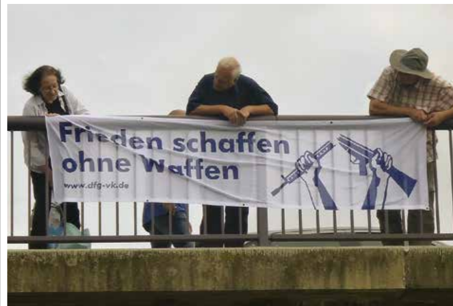
Die zentrale Handlungsanweisung der DFG-VK in Cochem an der Mosel

fang August waren wir in Büchel. Und doch wieder nicht, denn auf einen Fototermin vor dem Haupttor verzichteten wir. Wir hatten schon vor zwei Jahren Erfahrung mit einer Blockadeaktion gesammelt. Sie hatte bei uns zwiespältige Gefühle zurückgelassen. Diesmal war unser Anliegen deshalb ein anderes. Wir