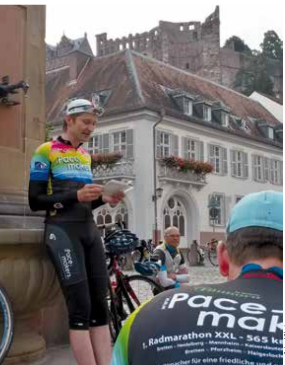
Anti-Atomwaffen-Kundgebung in Heidelberg

Am 6. August, dem 71. Jahrestag des Atombombenabwurfs auf Hiroshima, waren um 5 Uhr 45 über 120 Radler in Bretten für den mittlerweile 12. Pacemakers-Radmarathon von Bretten über Heidelberg, Mannheim, Kaiserslautern, Ramstein, Neustadt/Weinstraße zurück in die Melancthonstadt aufgebrochen. Zum wiederholten Mal gefilmt vom SWR-Fernsehen. Das Peloton auf der 340 Kilometern langen Strecke wuchs zwischenzeitlich auf fast 150 Radler an, die als Botschafter für nukleare Abrüstung unterwegs waren. Eskortiert von und mit dem sicheren Schutz durch die Polizei sowie durch die Pacemakers-Begleitfahrzeuge (Führungs- und Schlussfahrzeug, zwei Besenwagen, Pannenzüge).