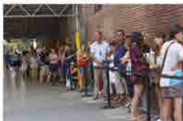
Vor vielen Zoohandlungen bildete sich eine lange Schlange.

Ähnliche Szenen wie in Wernis Zooecke spielten sich heute im ganzen Bundesgebiet ab; selbst große Zoohandlungen vermelden leere Hamsterkäfige.