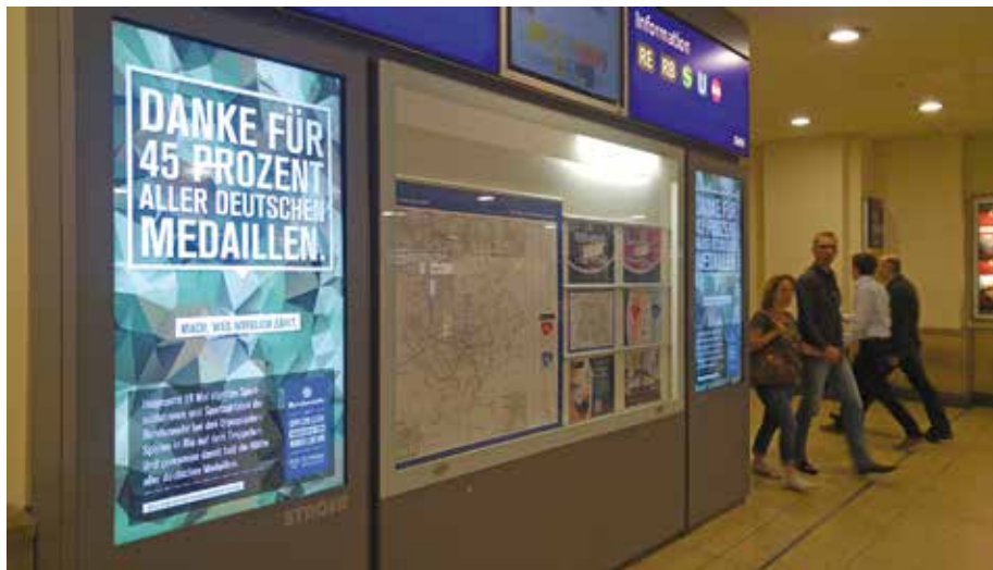
Flächendeckende Bundeswehr-Propaganda im öffentlichen Raum, hier am Hauptbahnhof in Hannover

Bereits Wochen vor Beginn der Sommerspiele in Rio startete die Bundeswehr eine massive Werbekampagne: „Mit ihren SportsoldatInnen wirbt die Armee für den Dienst an der Waffe: Die Bundeswehr ist aber kein Sportverein“, kritisiert Buchterkirchen. Die Friedensorganisation klärt auf ihrer Aktionswebsite www.militaerfestspiele.de über die Werbekampagne der Armee auf. Dort fordern die AktivistInnen auch, jede weitere Zusammenarbeit zwischen dem Deutschen Olympischen Sportbund (DOSB) und der Bundeswehr zu beenden, da diese gegen die Satzung der Sportorganisation verstoßen würde. Zudem kritisiert die DFG-VK auf dieser Website, dass die Bundeswehr-Sportförderung den oft jungen SpitzensportlerInnen keine langfristige Perspektive bietet. Auch das ist ein Grund für die unterdurchschnittliche Leistung der SportsoldatInnen: „Junge SportlerInnen, die an ihre Zukunft den-