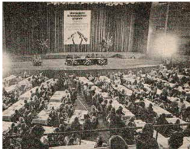
DFG-VK-Fusionskongress 1974 in der Bonner Beethovenhalle