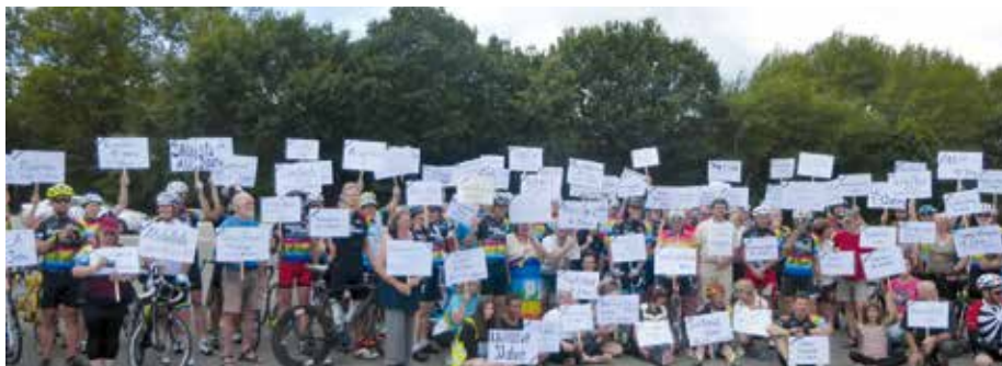
Mahnung und Protest vor der US-Air-Base Ramstein: Die Namen pakistanischer Drohnen-Opfer