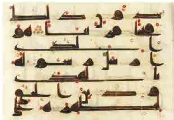
Seite 46, Vers 28, Er ist es, Der Samen Gessamten mit der Führung und der wahren Religion geschickt hat, auf dass Er sie über alle andern Religionen siegen lassen über Allah geschickt als Zeuge

Angabe - 54. Jahrgang - 7,50 € - G 11009