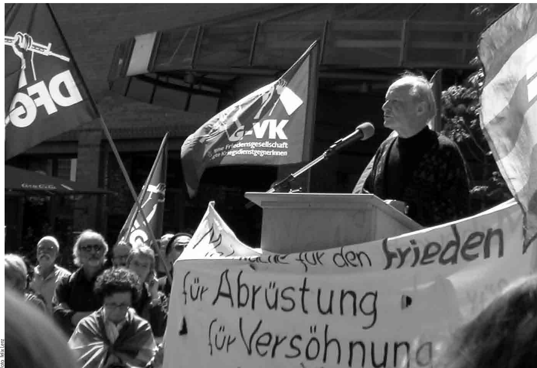
Eugen Drewermann: Krieg ist keine Option, sondern ein Verbrechen

Viele TeilnehmerInnen nutzen die Möglichkeit, zusätzlich individuelle Botschaften an die Parteien zu übermitteln: „Sehr geehrte MdBs, 20 Jahre nach dem gewaltfreien Fall DER MAUER sollten Sie endlich auch weltweit gewaltfreie Lösungen fordern.“ „Dass Deutschland im