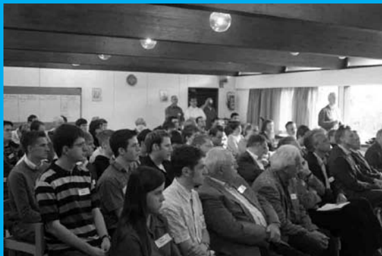
TeilnehmerInnen der Maintaler Tagung

Wir treten für die Fortentwicklung, staatliche Finanzierung und Praktizierung ziviler Konfliktbearbeitung und den gleichzeitigen Abbau von Militär und Rüstungsproduktion als untaugliche und kriegsfördernde Auseinandersetzungsmittel ein.