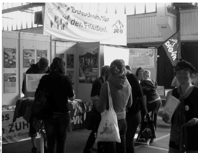
DFG-VK-Stand auf dem Markt der Möglichkeiten

Auch eine eigene Veranstaltung der örtlichen DFG-VK-Gruppe oder Friedensinitiative zum Thema „Außen- und Sicherheitspolitik der Parteien“ bietet sich natürlich an. Obwohl Themen um Krieg und Frieden in den Medienberichten alle Tage zu finden sind, ist dies nicht ein herausragendes Thema im Wahlkampf. Machen wir es doch dazu! Vielleicht auch zusammen mit anderen Gruppen wie attac (Auslandseinsätze und Globalisierung), mit kirchlichen Gruppen (Rüstungsexport und Entwicklungspolitik) oder auch den Gewerkschaften (Rüstungsausgaben in der Krise). Zu den drei Forderungen der Botschaft für Frieden gibt es in der DFG-VK sachkundige Aktive, die man zu solchen