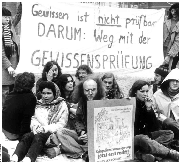
DFG-VK-Aktion in der siebziger Jahren

Der erste wenige Jahre zuvor in „Zivildienst“ umbenannte Ersatzdienst dauerte einen Monat länger als der Wehrdienst und war teilweise immer noch mit dem Makel des „Drückeberger“-Dienstes behaftet. Immerhin hatte im