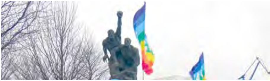
Denkmal für die revolutionären Matrosen in Rostock. Hier fand die Auftaktkundgebung des Ostermarsches statt. Damit wurde an die revolutionären Traditionen der Stadt erinnert. Vor 110 Jahren begann der Erste Weltkrieg. Der Aufstand der Matrosen 1918 leitete sein Ende ein.

gezogen. Manche mögen einwenden, das Wort Faschismus wäre übertrieben. Wo sind die Fackelzüge, wo die Verhaftungen, wo die Toten? Ab wann dürfen wir es Faschismus nennen? Ab 20 % oder ab 50 % des Weges? Ob wir uns nun im dritten von zehn oder im achten Schritt von 30 befinden, spielt für mich keine Rolle. Für mich war schon der erste Schritt einer zu viel.“ Merkmale des Faschismus sind seiner Meinung nach in der aktuellen Regierungspolitik alle erfüllt.