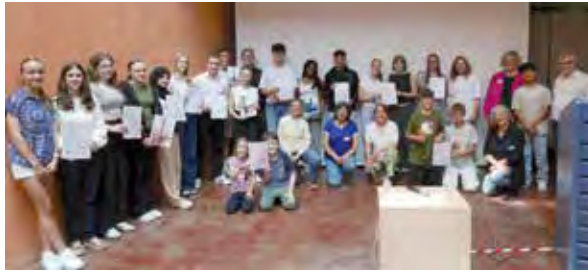
Preisverleihung in Karlsruhe

schiedlichen Altersstufen und Schularten gerecht zu werden, haben wir in diesem Jahr fünf zweite Preise mit jeweils 250 Euro Preisgeld ausgelobt: Die Klasse 3 der Spitalhofschule in Ulm hat ein E-Book gestaltet zum Thema „Was ist für