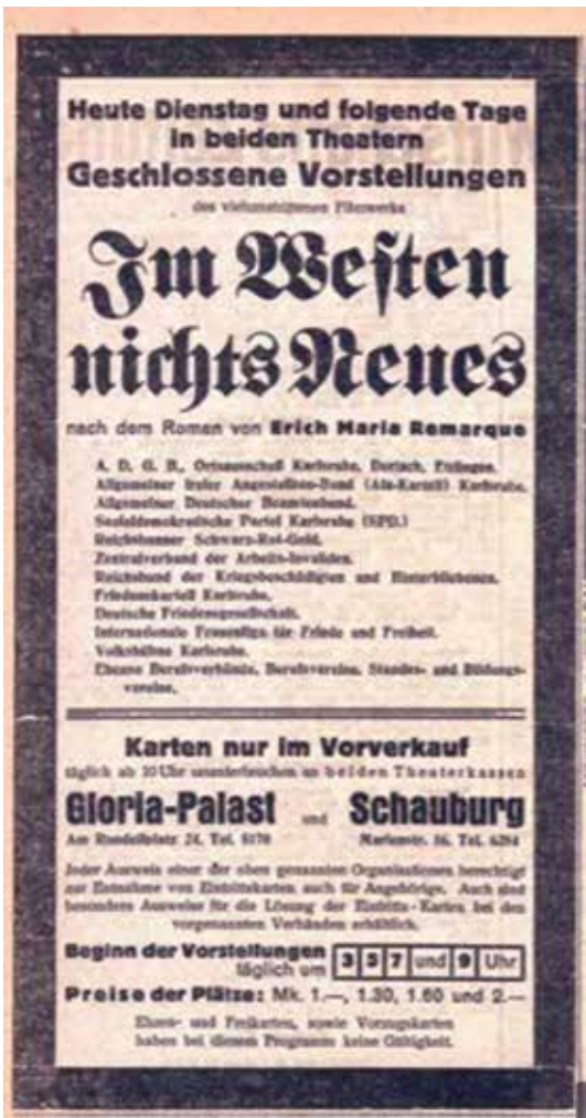
Badische Presse vom 28.7.1931