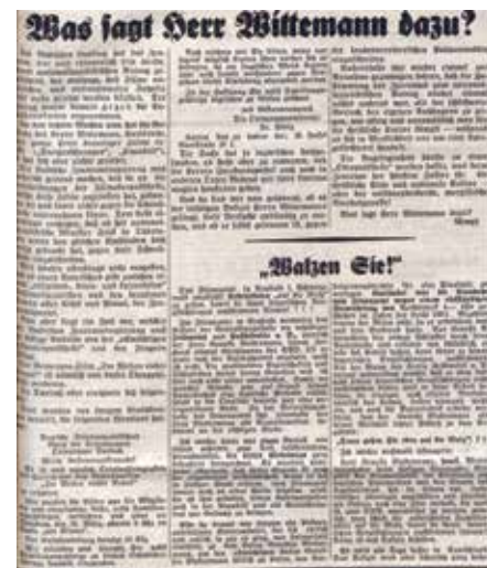
Tageszeitung „Der Führer“ vom 24.3.1931

Nach dem Verbot trieb die nationalsozialistische Propaganda dann die bürgerlichen Landesregierungen vor sich her. Dazu ein Beispiel aus der damals noch selbständigen Stadt