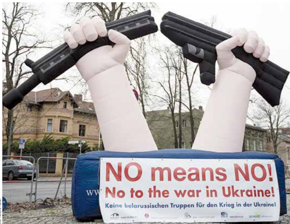
Zerbrochenes „Pustegewehr“ vor der belarussischen Botschaft in Berlin am 20. Februar

Das European Bureau for Conscientious Objection (Ebco), die WRI, die International Fellowship of Reconciliation (Ifor) und Connection e.V. riefen Russland und die Ukraine zur Gewährleistung des Menschenrechts auf Kriegsdienstverweigerung auch in Kriegzeiten auf. Sie fordern die sofortige Freilassung von Vitaly Alekseenko und rufen insbesondere russische Soldat*innen zur Verweigerung des Kriegsdienstes auf. ( https://bit.ly/3UOpCRo )