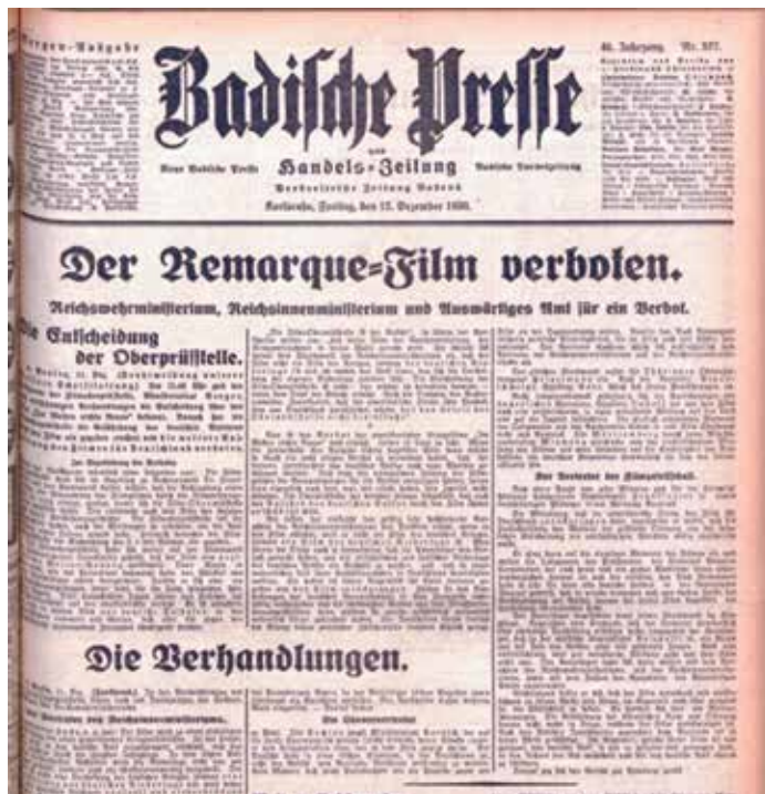
Badische Presse vom 12.12.1930

Die deutsche Uraufführung am 4. Dezember 1930 vor prominentem Publikum verlief noch ohne Proteste, aber schon am nächsten Tag wurde unter Leitung von Joseph Goebbels, damals NSDAP-Gauleiter von Berlin, von SA-Männern die Vorführung mit Mäusen und Stinkbomben gesprengt mit dem Ziel, ein Verbot des Films zu erreichen. Und bereits eine Woche später erreichten die Nationalsozialisten dies: Die Reichsfilmprüfstelle verbot unter Verweis auf die öffentliche