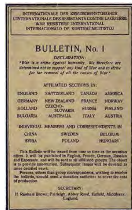
WRI-Bulletin Nr. 1 von 1923 (Quelle: https://bit.ly/3J34K3M )

• „Der Krieg ist ein Verbrechen an der Menschheit“ bezieht sich auf den Krieg als solchen und jeden Krieg. Be-